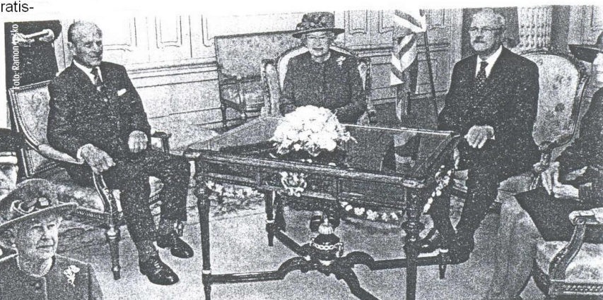
Pózovanie pre fotografov v prezidentskom paláci