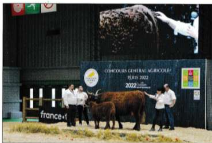
Krava a teľa regionálneho mäsového plemena aure et Saint-Girons počas hodnotenia.