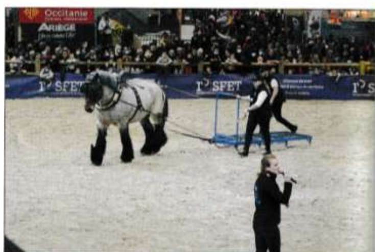
Ukážky práce ardénskeho plemena pri ťahaní nákladu.