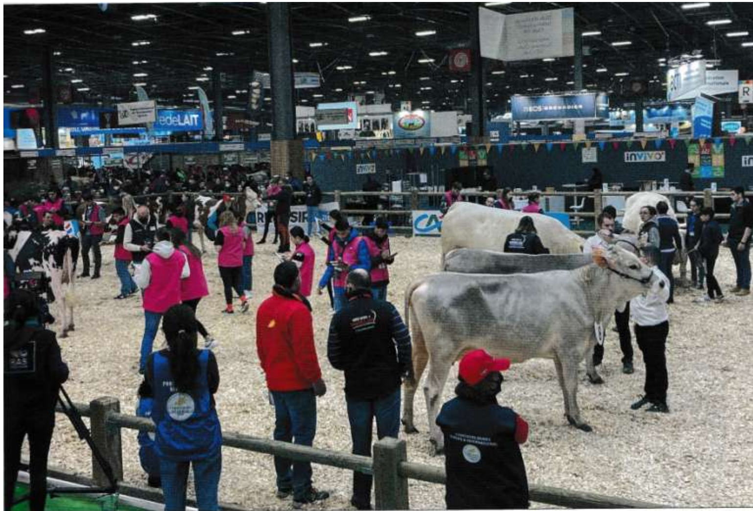
Atmosfera súťaže mladých bonitérov exteriéru HD.