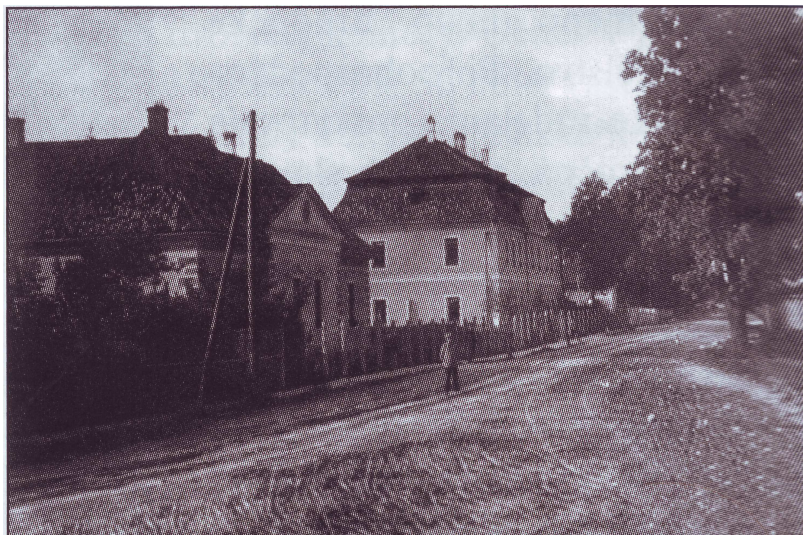
Budova školy v 20 rokoch 20. stor.