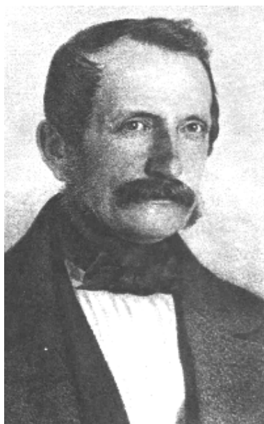
Daniel G. LICHARD 1812 - 1882