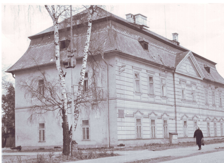
Stav budovy prvej poľnohospodárskej školy v vyučovacím jazykom slovenským v roku 1986 / 100 rokov od jej zrušenia v dôsledku zosilneného maďarizačného tlaku /

Popri stálom fungovaní nižšej odbornej hospodárskej školy na pôde horárskej školy, organizovalo vedenie tejto školy aj pravidelné roľnícke kurzy a to pre roľníkov, pre vojakov prezenčnej služby a cez prázdniny aj pre učiteľov ľudových škôl hospodárskych.