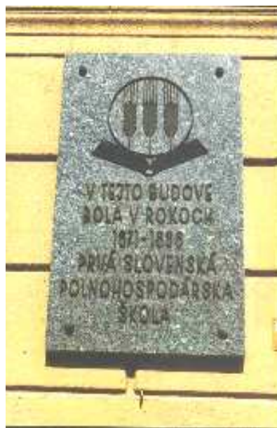
Pamätná tabuľa na budove prvej slovenskej poľnohospodárskej školy v Lipt. Hrádku