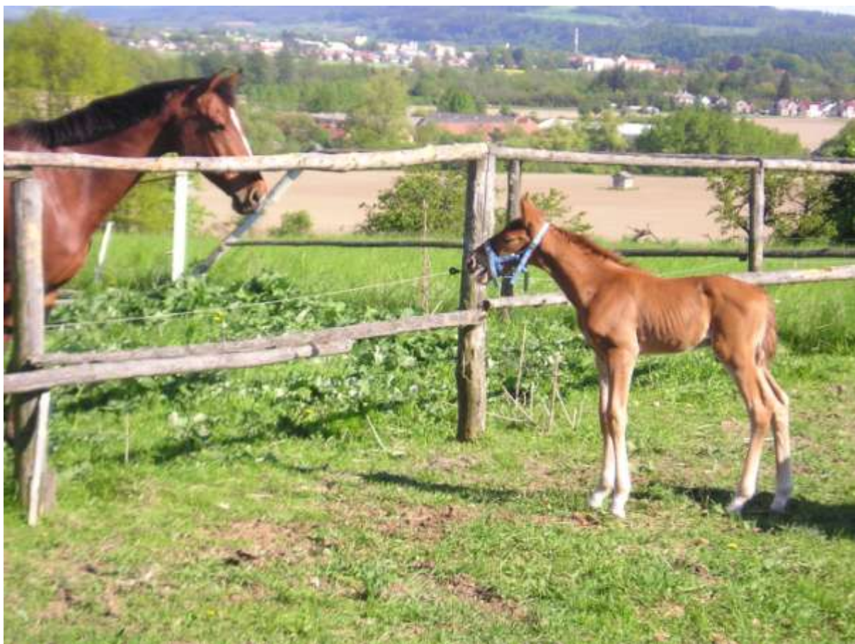
Snapping u 2 dňového žriebäťa.