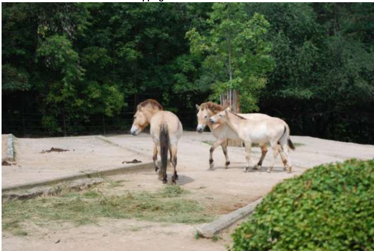
Snapping u staršieho žriebäťa.