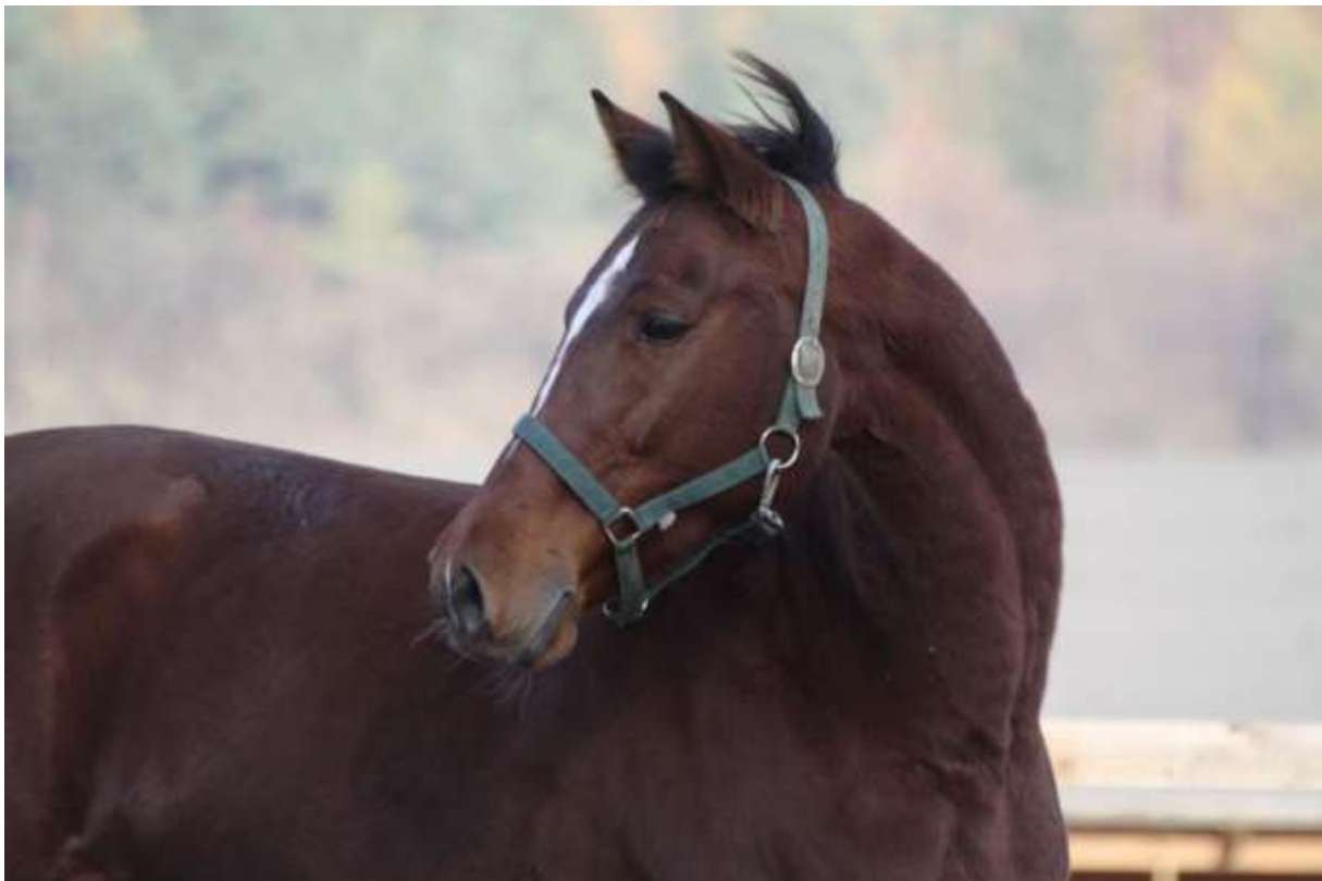
Komunikácia - držanie hlavy, krku, tela, poloha ušných boltcov.