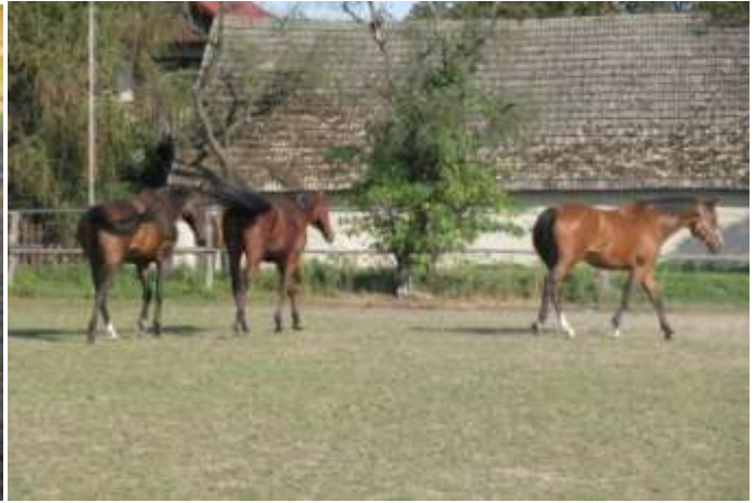
Odháňanie múch chvostom

Obtíranie o predmety : https://youtu.be/yKcpBi8Qkyo