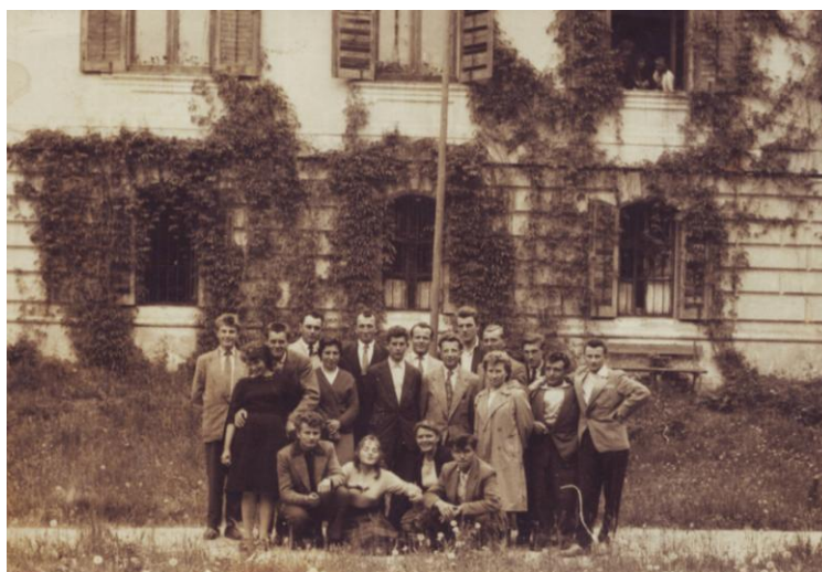
Jedni z posledných absolventov PMŠ pred budovou kaštieľa v roku 1961

V školských rokoch 1954/1955 a 1955/1956 mala Poľnohospodárska učňovská škola RÁZTOKY pobočku v obci HYBE. Táto pobočka zabezpečovala vyučovanie v jednoročnom učebnom odbore chovateľ a za dva školské roky svojho pôsobenia ju ukončilo 33 absolventov. Na prvom obrázku je súčasný stav budovy v ktorej na prvom poschodí / štyri veľké okná / mala škola svoje vyučovacie priestory a na druhom obrázku je budova v ktorej mala škola internát.