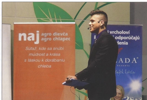
Spolumoderátorom bol rapper Parazit.