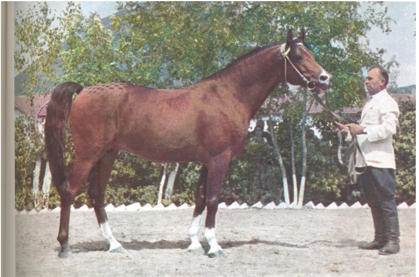
Obr. 13. Arabský plnokrvný žrebec Araks, uliah. 1952; O: Amurat, M: Awgara, Pepinier Terského žrebčína v ZSSR