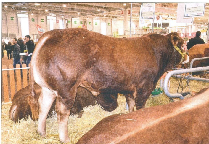
Tento plemenník plemena limousine mal živú hmotnosť 1 173 kg.