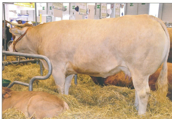
Táto krava plemena blonde d'Aquitaine sa vyznačuje veľmi dobre utváraným zadkom.