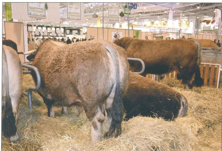
Prvý plemenník zľava (plemeno aubrac) je skutočným expertom. Nielen kvalitou, ale aj podľa mena.